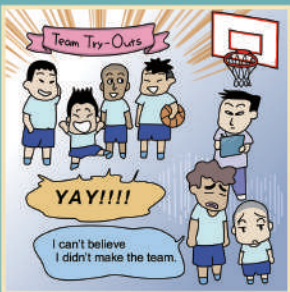
漫畫／內田裕紀 腳本／Sloan Sabbith