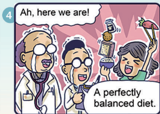
▲啊，有啦！這位均衡飲食，什麼都吃！