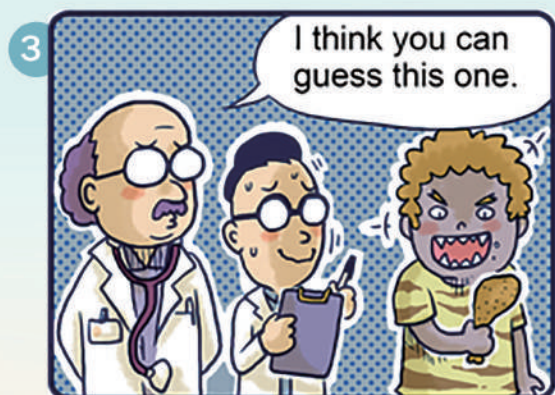
▲看他樣子就知道是什麼偏食。