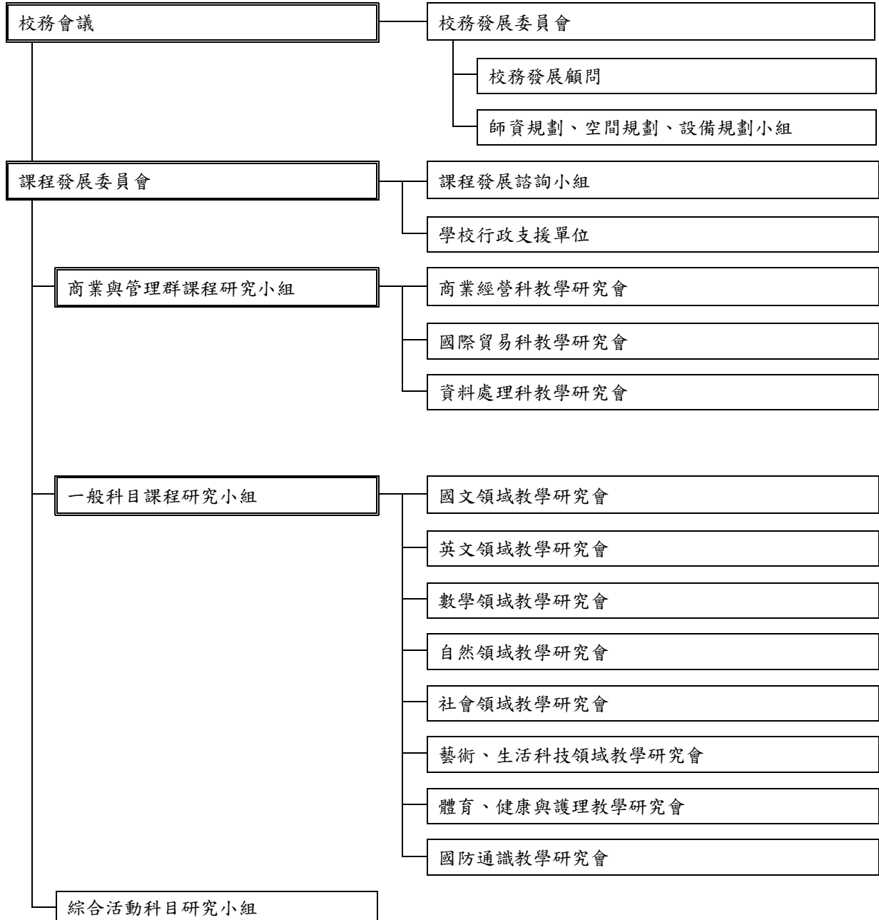
圖 1 課程發展組織架構圖