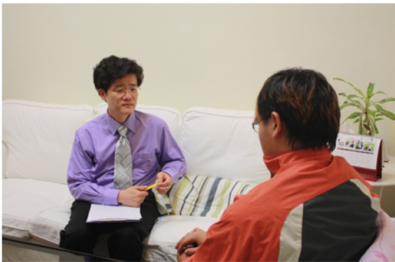
史莊敬心理師與學生晤談