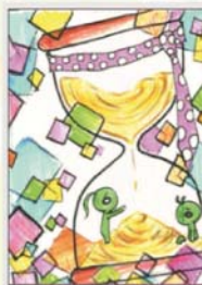
圖二 高一 陳穎如

在性平法第2條規定性霸凌：指透過語言、肢體或其他暴力，對於他人之性別特徵、性別特質、性傾向或性別認同進行貶抑、攻擊或威脅之行為且非屬性騷擾者。根據兒盟的調查，孩子最常被性霸凌的是對性徵或身材的嘲笑，方式有開黃腔、女生被形容為波霸、飛機場等。另外還有超過半數的性霸凌，來自侵犯身體的行為或遊戲，