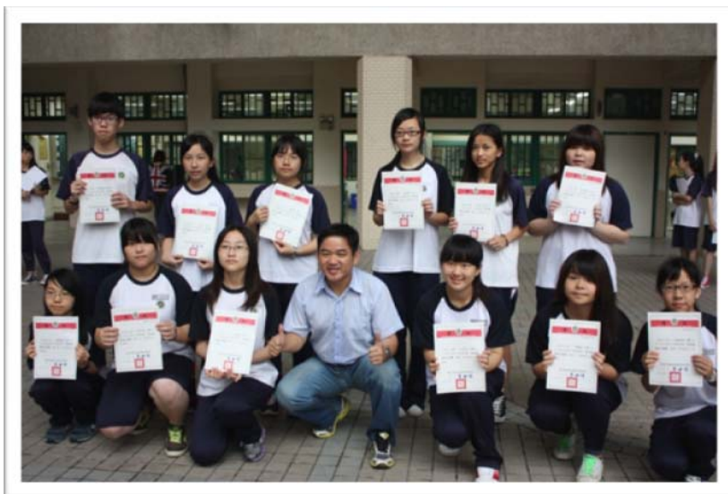
學習檔案競賽得獎同學