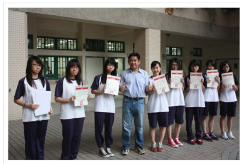
生活部落格影片競賽得獎 同學