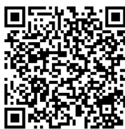
iNTUE 校務整合資訊系統