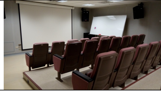
圖 2-3-10 是 20-50 人空間及設備規劃，以視聽服務為主，可作為定期節目欣賞或演講、研習、推廣活動、教育訓練等多功能使用空間。

圖 2-3-8 透過美感設計規劃設置柔性視聽空間，增加圖書館美感空間，提升學生空間美感素養。