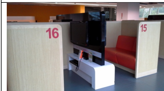
圖 2-3-5 小型分組視聽區除注意使用人數規劃外，亦應注重空間隔離，以及不影響其他閱讀空間利用。