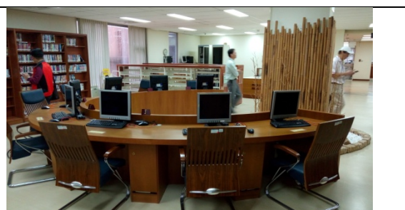
圖 2-3-2 個人視聽空間可規劃環型空間排列方式。