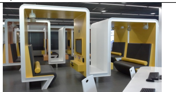
圖 2-3-6 運用各校空間，規劃設計小型分組視聽區空間造型，可強化學生使用意願，增加空間設計美感。