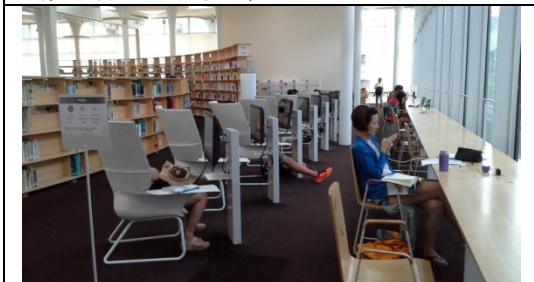
圖 2-3-3 個人視聽空間可規劃直行空間排列方式。