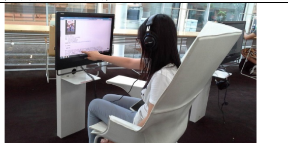
圖 2-3-4 個人視聽空間設備可規劃 All IN ONE 觸控式電腦，以節省空間規畫需求。