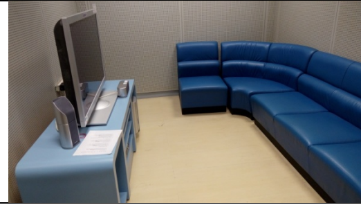
圖 2-3-9 是 5-10 人空間及設備規劃，需重視空間隔音、音響設備、座位區設計及空調等，不影響其他閱讀空間利用。

圖 2-3-7 小型分組視聽區亦可設置柔性空間，例如沙發視聽區，提供學生能在舒適環境中學習。