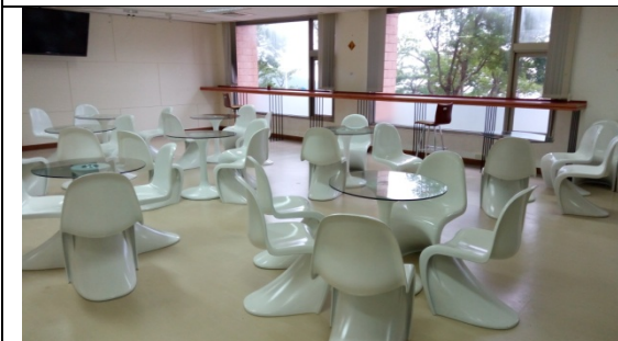
圖 3-1-7 在不干擾其他人員及空間運作下，規畫提供開放式的討論空間供學生使用。