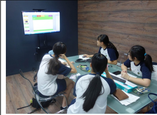
圖 3-1-3 封閉式討論空間區，透過裝潢隔間來隔離外界干擾，讓學生能安心專心自主學習討論與製作。