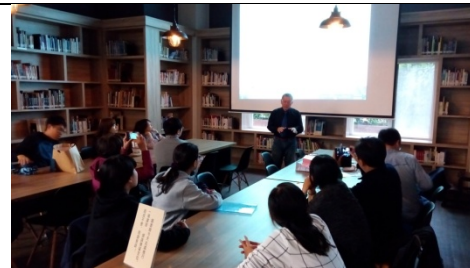
圖 3-1-10 是 20-50 人空間之討論室，亦可利用圖書館使用空間，規劃成開放式討論空間，作為講座、與作家有約等，具環繞書香氣息空間場域(圖片提供:鄭華鈞)。