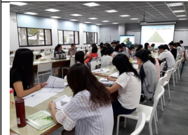
圖 3-1-9 是 20-50 人空間之討論室，以視聽服務為主，亦可作為班級共讀、定期節目欣賞、演講、研習、推廣活動、教育訓練等多功能使用空間。