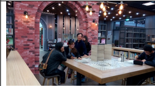
圖 3-1-5 半開放式討論空間，透過空間隔板或活動架，固定或暫時性隔離局部空間供學生作為討論區。