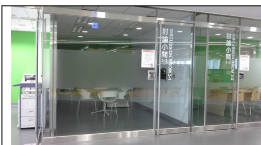
圖 3-1-1 封閉式討論空間區，空間設計及裝潢上需特別注意隔音問題，以免與其他空間產生干擾。

各校可依校內經費及現行空間，自行規劃合適場域，提供師生利用。以下僅就各校或公共圖書館討論間案例圖片，提供規劃參考。