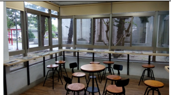
圖 3-1-6 開放式的討論空間較節省資源，可針對學生需求規劃圖書館局部空間成立閱讀角落建置。