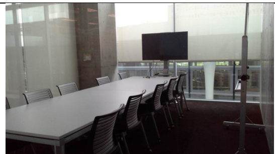
圖 3-1-8 是 5-10 人使用之獨立空間，除可為小團體共同討論及觀賞視聽資料之場所，亦可作為簡報或小組教學之場所。