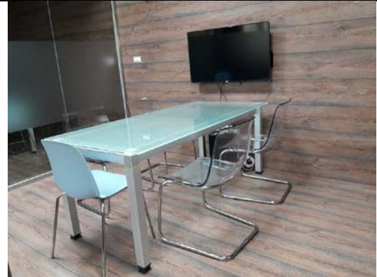
圖 3-1-4 經過妥善的設計規劃，可提供學生優質討論空間與設備，提升圖書館整體空間美感(圖片提供:梁家玉)。