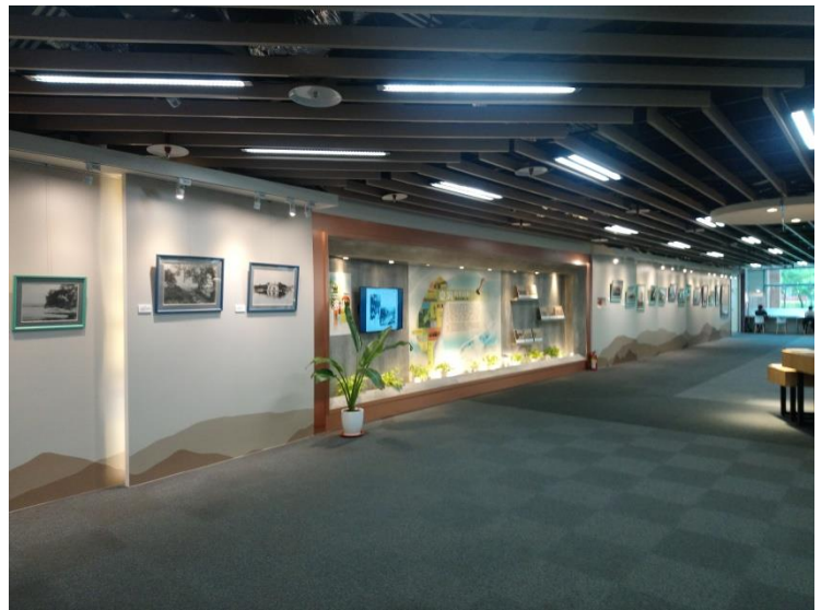
一樓臺灣藝文走廊