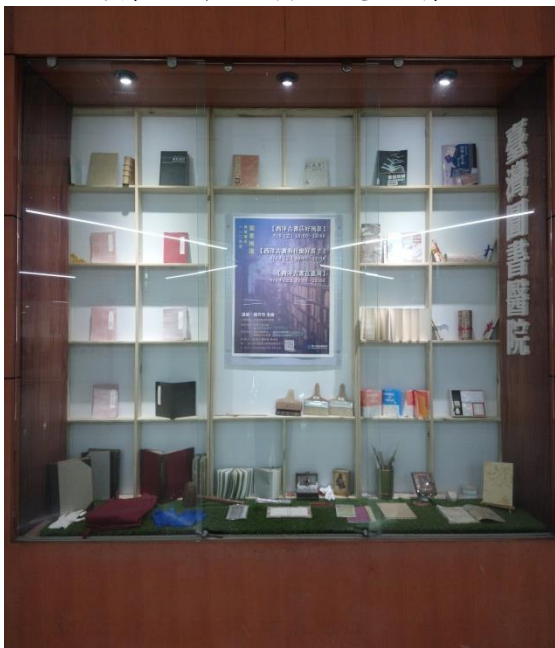
一樓大廳閱讀櫥窗-1(共 4 個)