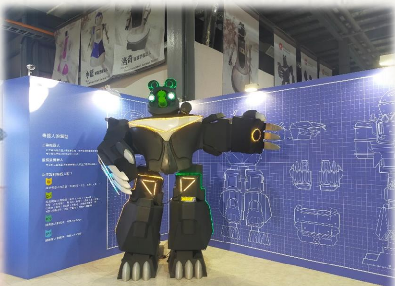
➤ 胸前有 V 型特徵的台灣黑熊機器人