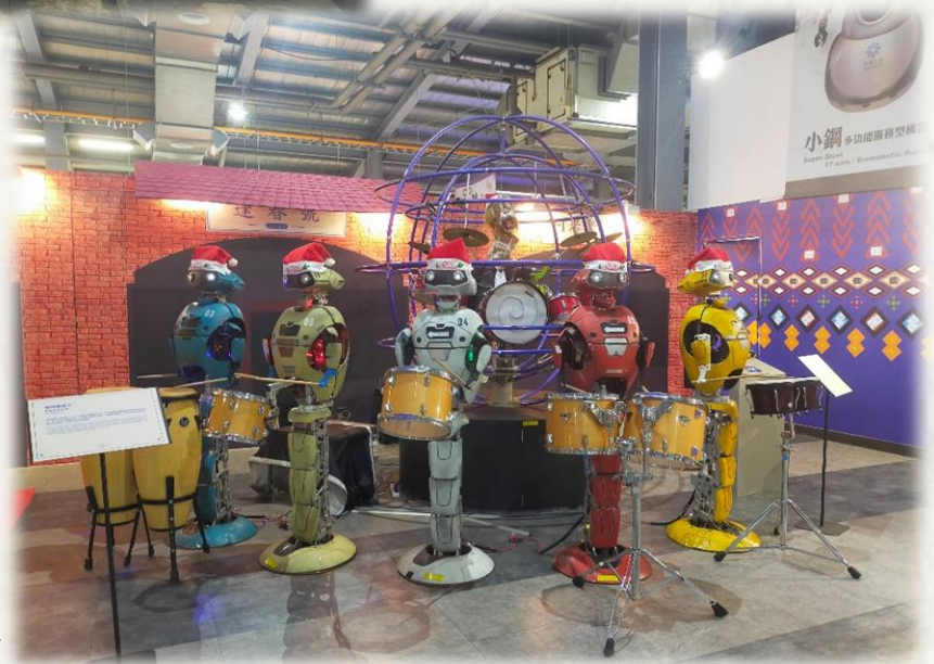
➤ 由機器人組合而成的打擊樂隊