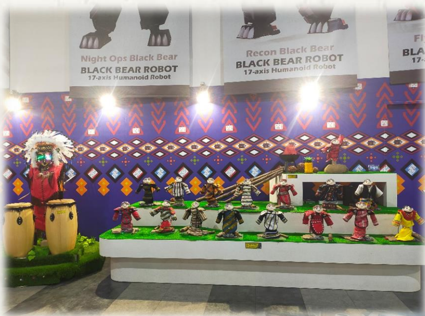
➤ 本土文化與科技的結合-原住民機器人