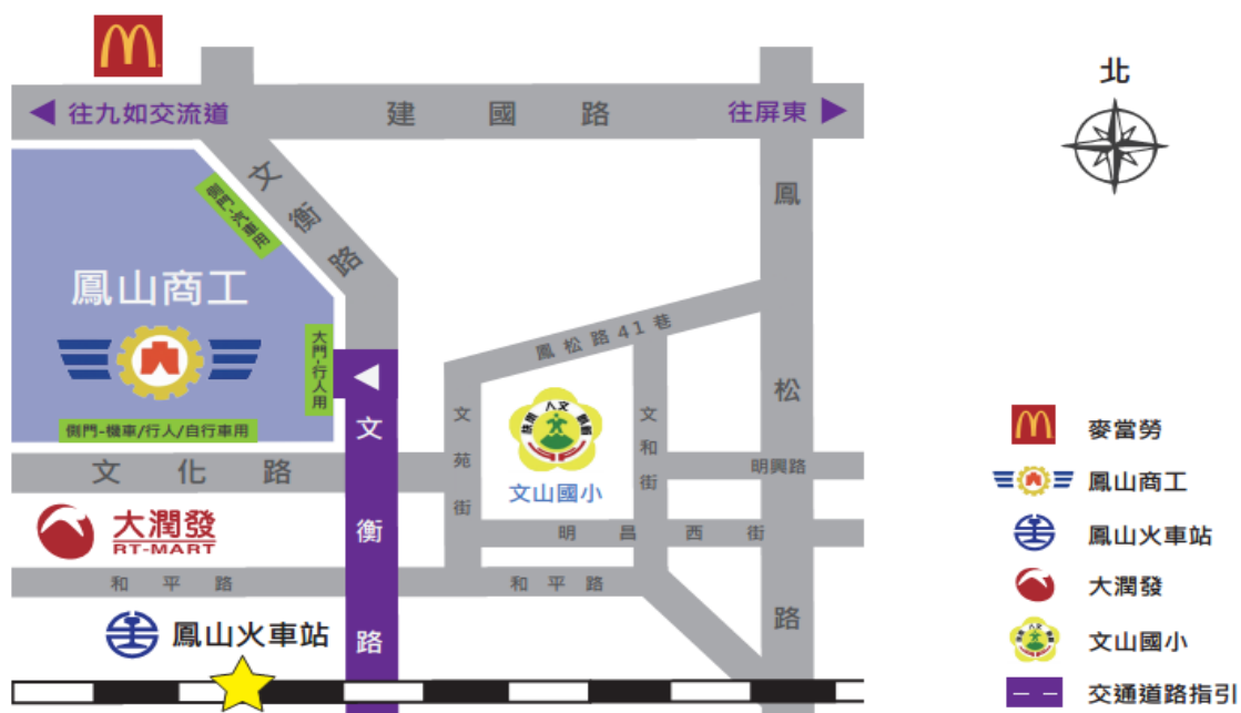
國立鳳山高級商工職業學校 交通位置示意圖