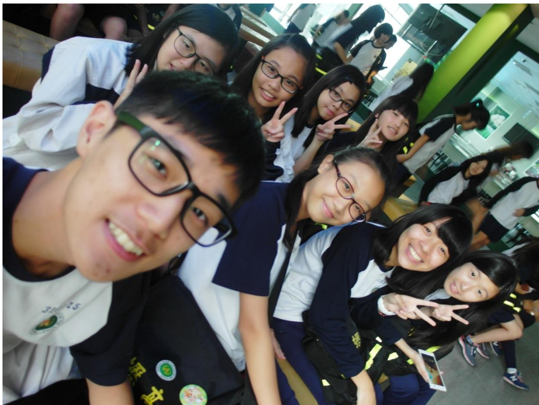
<白木屋品牌探索館>