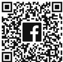
中壩高商 粉絲專頁