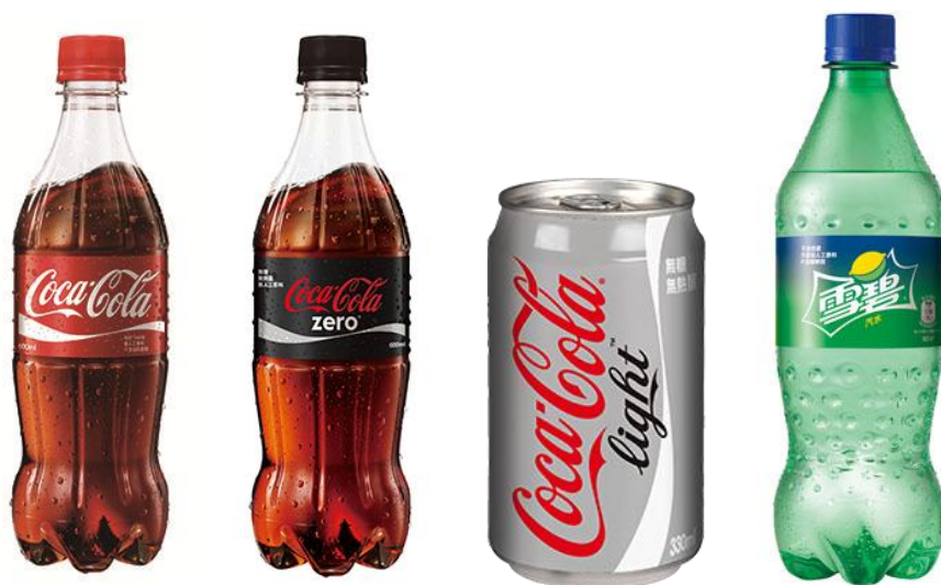
可口可樂 可口可樂 ZERO 可口可樂 LIGHT 雪碧