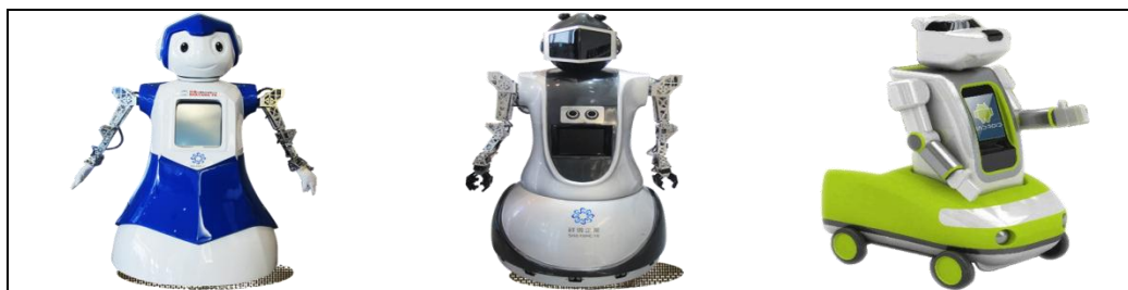
全方位導覽型機器人