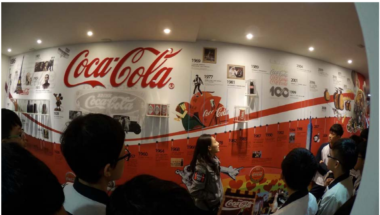
►導覽員正在解釋可口可樂的歷史，如何形成如此龐大的商機。