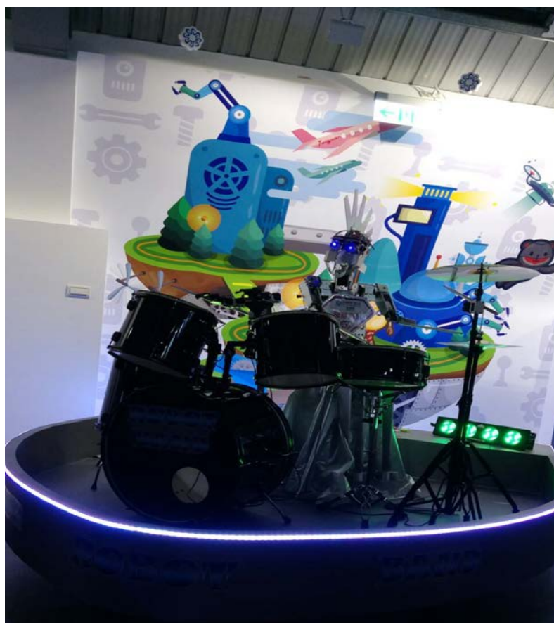
▶他還會打鼓唷，跟著歌的節奏