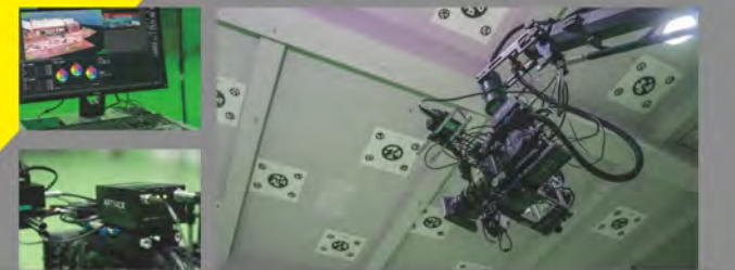
• 光學追蹤系統、電影高速攝影機、電動遙控機器手臂系統