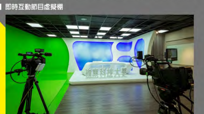
■ 即時互動節目虛擬棚