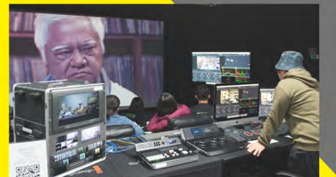
■ 數位剪輯與調光教室