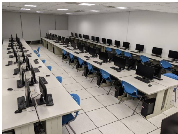
視覺特效專業電腦教室