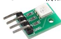
RGB LED 模組