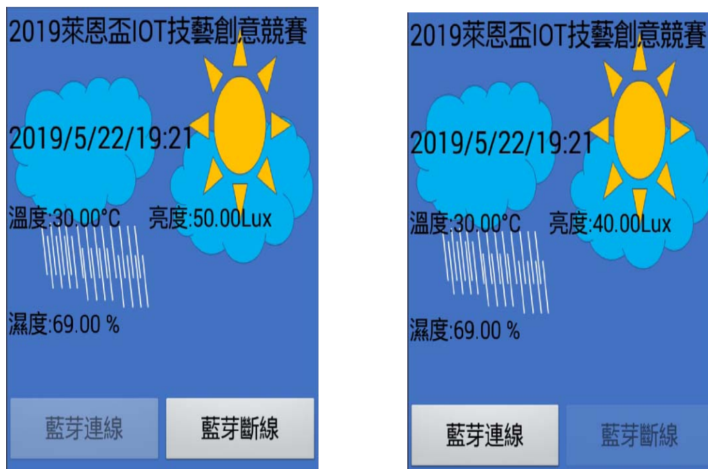
圖 2、手機顯示畫面，左-藍芽連線，右-藍芽斷線的功能選項[顯示畫面為參考用]