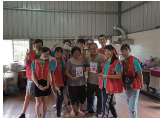
▲ 長者收到暖心卡片與志工共同露出幸福的笑容