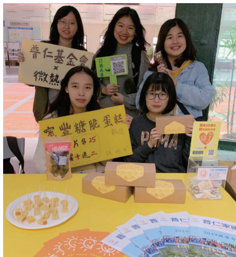
▲ 義賣過程，學生們絞盡腦汁思考行銷策略，期望能以專業達成服務目標。

因此，若能讓學生以自身專業與非營利組織夥伴合作，既能提供行銷上的支持，又能讓學生們走出校園、看見社會需要。於此同時，專業與服務的齒輪，已接連扣上，以服務為中心的企業概論課程，因而誕生。