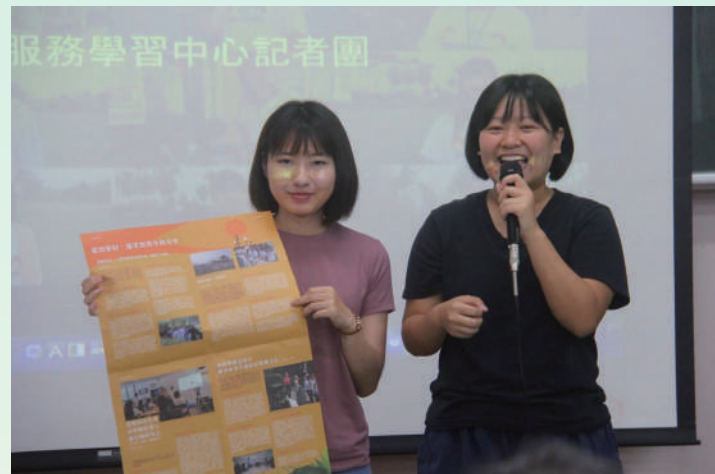
▲ 詠庭及育恩在記者團招募說明會中，與學弟妹分享獲取的收穫及成長