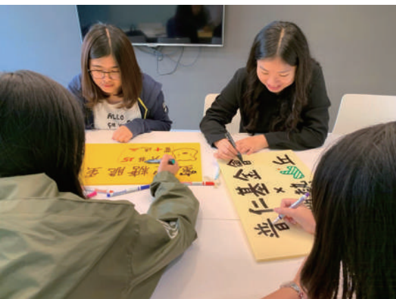
▲ 每組同學都用心的製作義賣宣傳海報