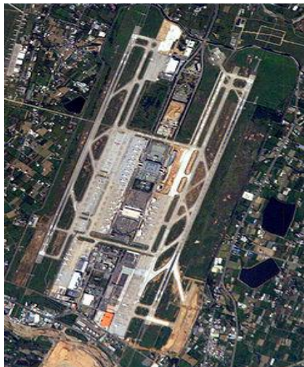
<桃園機場空照全貌圖>

早年由於中華人民共和國政府與蔣中正之間的對立情節避免提及蔣中正的名字，而普遍以「臺北桃園國際機場」的方式稱呼之，2006 年 9 月 6 日，行政院院會通過決議，將中正國際機場更名為「臺灣桃園國際機場」並即刻生效。透過立法程序，將機場經營權由民航局轉為國營機場管理公司負責，以期提昇機場營運效率。桃園機場的營運單位——桃園國際航空站，依此於 2010 年 11 月 1 日改制為桃園國際機場公司，並改由中華民國交通部直接監管，不再由民用航空局管轄。<來自維基百科>