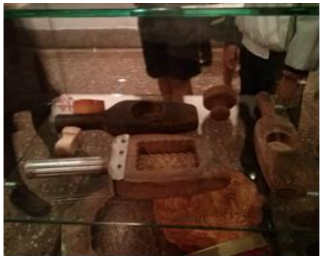
左圖<大型餅乾生產滾模。現已無生產此種餅乾，是古時最熱門的零食。>