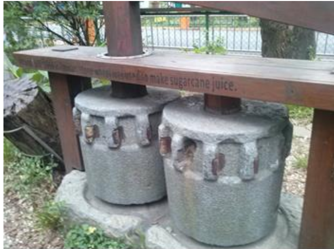
<榨甘蔗汁的器具。一端綁著牛，中間慢慢放入甘蔗，從圓孔榨出汁>