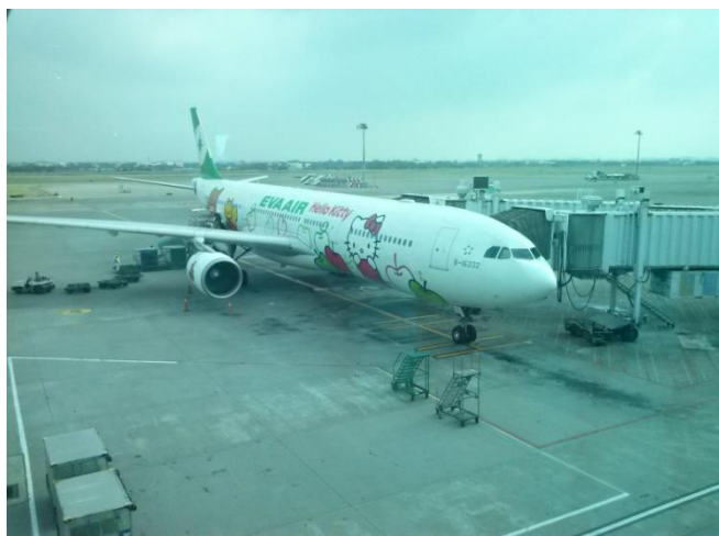
<Hello Kitty 飛機>

長榮航空公司為因應現代熱潮，而做很多有關 Hello Kitty 的東西，像是 Hello Kitty 的查票機、衛生紙、撲克牌、飛機等。 飛機上的東西全部都是 Hello Kitty，如果旅客是 Kitty 貓迷，不妨多花一點錢去體驗看看，不同的感覺。