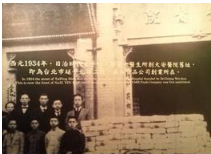
<當年蔣渭水開設的「大安醫院」。>

雖然在門市已改建成現代建築，但店外廊柱掛牌仍記錄這裡與蔣渭水的淵源，承接歷史的意義，且「義美食品」也不忘本，堅持採用台灣各地食材生產優良產品的公司，目的就是要讓這塊土地上的人，品嚐最道地的台灣味，並致力於蔣渭水相關的文史活動，為這塊土地奉獻心力，成為企業支持台灣文史的良好典範。相信大家看著原址的義美食品時，一定會對台灣的民族文化與自覺有所感動。