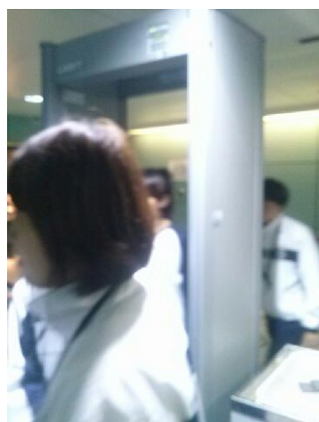
將參觀證過卡後，經過金屬探測門，如果有帶包包就必須經過紅外線的檢測。