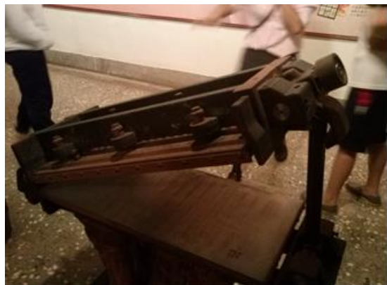
<製作夾心酥的器具。 器具上清楚可見方格狀>