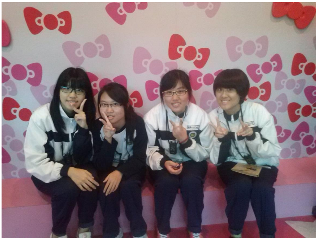
<桃園國際機場第二航廈查票區>