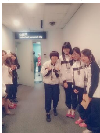
因為我們沒有機票無法過海關，所以只好走工作人員走的公務門。