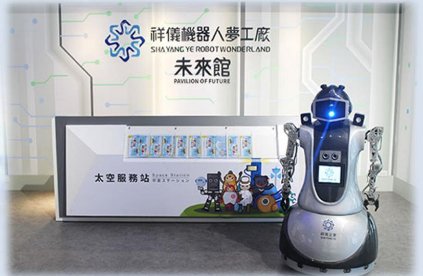
祥儀機器人夢工廠