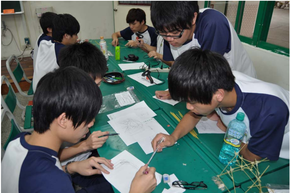
名稱： 100 義大利麵橋科學趣味競賽 時間： 101.05.10 (四)