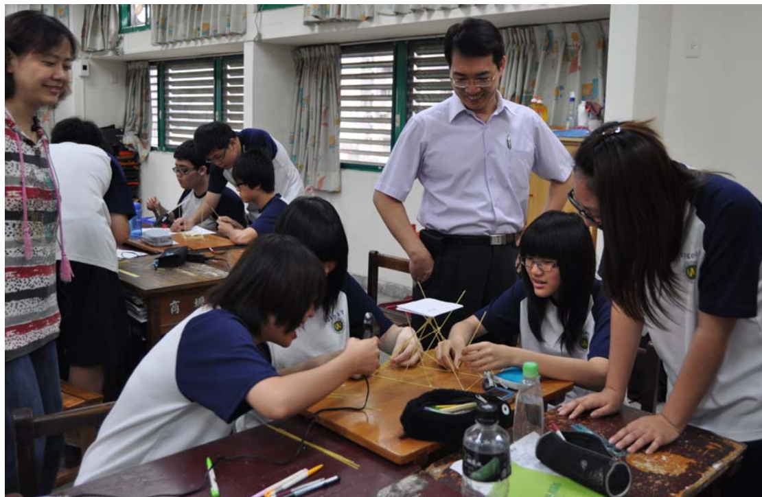
名稱： 100 義大利麵橋科學趣味競賽 時間： 101.05.10 (四)