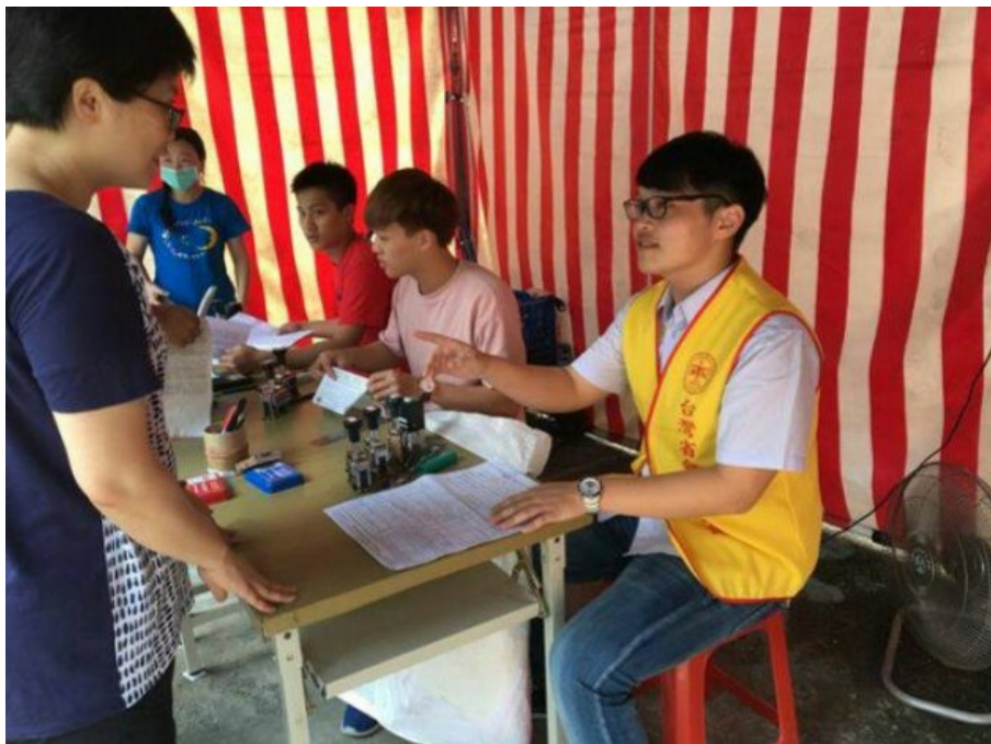
▲中壙高商落實學以致用

每年五月份是全國十多萬高職生參加四技二專統一入學測驗（簡稱統測）的重要時刻，但是今年五月份，中壙高商有一班高三學生不準備統測，而是開始當起會計師學徒，並預計在4年後成為桃園新一代的會計師接班人。