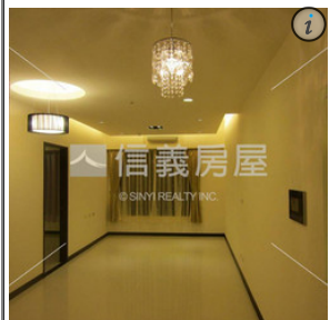
雲開花園二房車位