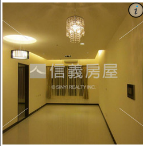
雲開花園二房車位

中壢高商會計專班的39名學生已於今年2月通過北商大會資系的產攜甄選管道，取得入學就讀資格。未來在北商大就讀期間，將不定期回媒合的會計師事務所服務學習，畢業後更直接留任於17家會計師事務所。中壢高商校長李世峰表示，「桃園市在邁向航空城之際，極需大量的會計人才為企業主規劃公司財務，因此中壢高商與臺北商業大學共同規劃“會計師養成人才5年培訓計畫”，預計為桃園及台北地區的會計產業栽培出新一代的會計師接班人。」中壢高商更希望能藉由與國立臺北商業大學及會計師事務所合作成功的產學計畫，喚起家長對技職教育的重視。