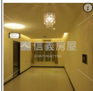
雲開花園二房車位